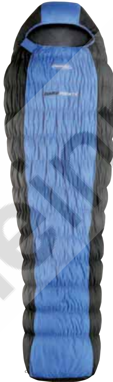
DIABLE 1200/1000/700 W.T.S.